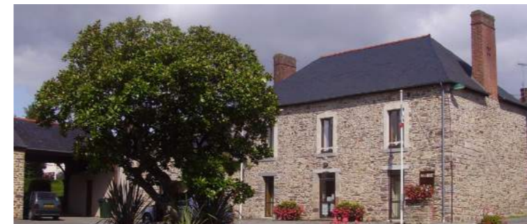
Commune de La Chapelle Bouëxic