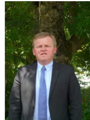
ASSOCIATION DES MAIRES RURAUX D'ILLE-ET-VILAINE (AMR 35)

La revue des maires ruraux d'Ille-et-Vilaine (35)